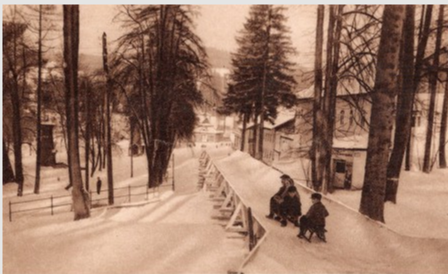
RABKA. Tor saneczkowy.