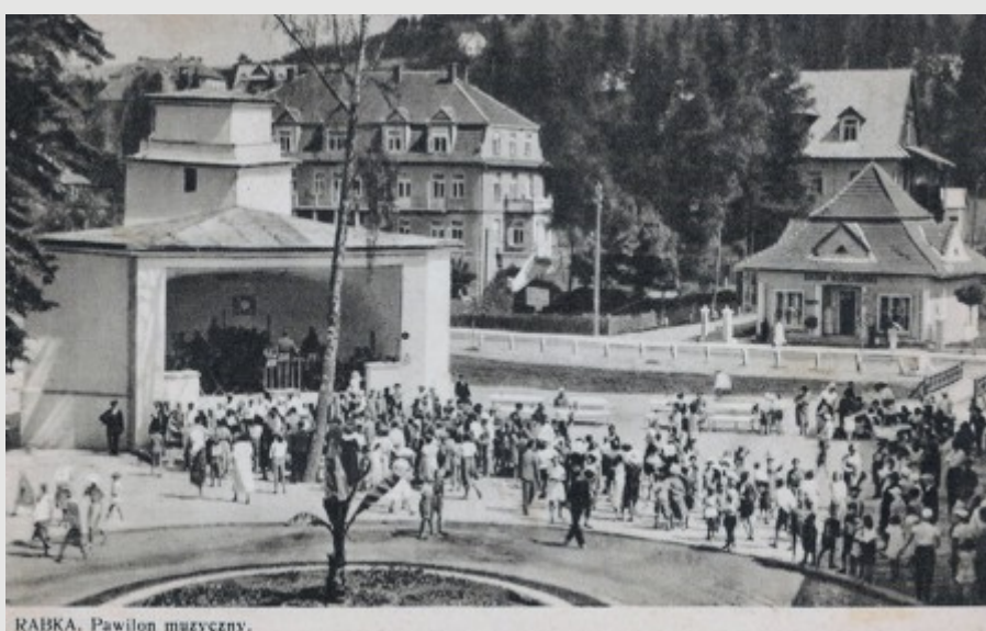
RABKA. Pawilon muzyczny.

10 czerwca 1947 roku zostaje otwarte pierwsze sanatorium obserwacyjne Zespołu w willi „Wiosna”, a 20 czerwca kolejne w budynku Oficerskiego Domu Wypoczynkowego. W miejsce Sanatorium Czerwonego Krzyża powstał Dziecięcy Ośrodek Sanatoryjno-Prewencyjny im. Wincentego Pstrowskiego na ok. 800 łóżek dla dzieci śląskich górników /dzisiaj Ośrodek Rehabilitacyjny im. dr. Adama Szebesty/. Istniejące Dziecięce Sanatorium Rodziny Kolejowej /dzisiaj Dziecięcy Szpital Uzdrowiskowo-Rehabilitacyjny Rodziny Kolejowej im. A Piłsudskiej /oddano również na cele walki z gruźlicą.