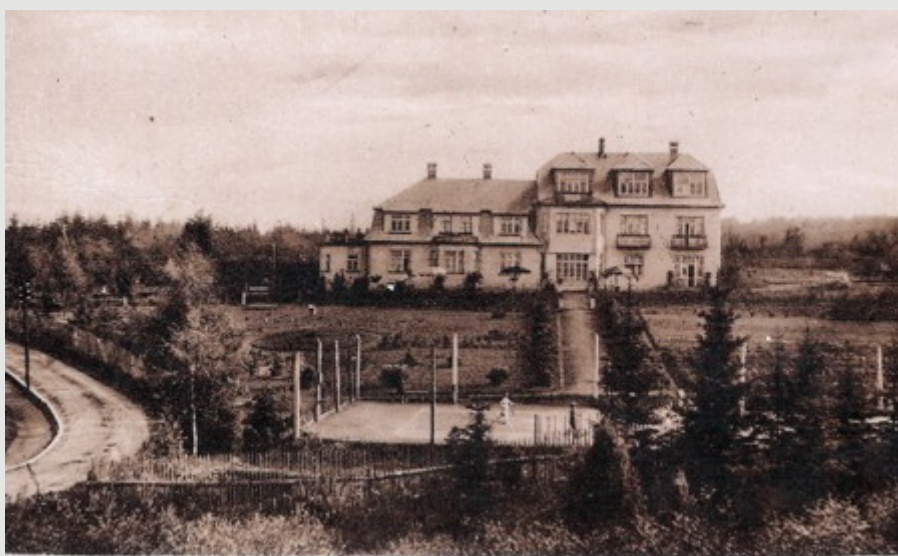
RABKA. »Nowy Świat« Pensjonat Szarotka.