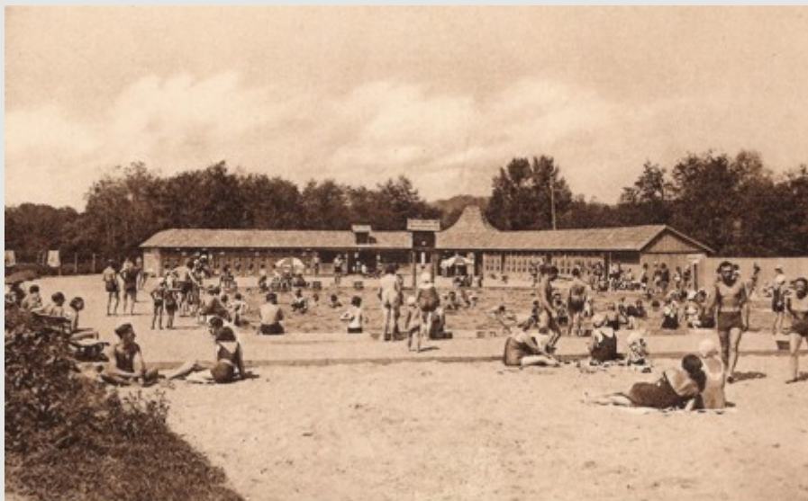
RABKA. Basen i Plaża.

Zniszczone po wojnie uzdrowisko zostało odebrane rodzinie Kadenów-Wieczorkowskich i przejęte na własność Skarbu Państwa.